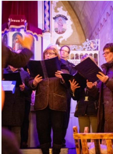
Chor bei der Christnacht 2018 in Urbich

In der Musikalischen Christnacht am Heiligen Abend gibt es Zeit zum Hören, Mitsingen und Genießen. Um 22.00 Uhr erstrahlt die geheizte St. Ulricikirche Urbich im Lichterglanz der Kerzen. Der Chor singt Weihnachtslieder und zu meditativen Texten erklingt die Orgel.