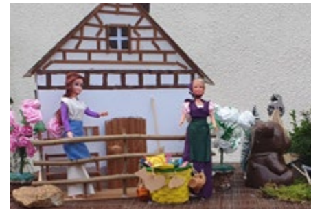
Märchen-Ausstellung in Niedernissa 2022