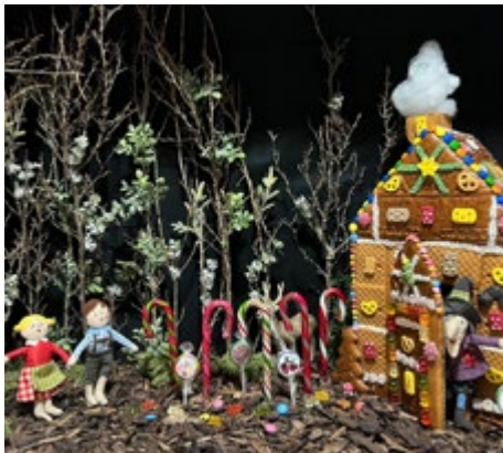
Märchen-Ausstellung in Niedernissa 2022