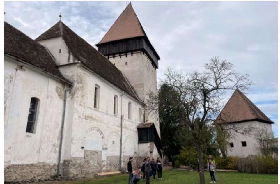
Siebenbürgische Kirchenburg in Holzmengen/Hosman

damit automatisch erstes Angriffsziel für Feinde. Aus diesem Grund kombinierte man Kirchen und Verteidigungsanlagen zu sogenannten Kirchenburgen. Nahezu jedes Dorf besitzt eine solche Kirchenburg. Sie sind heute nicht nur kulturelles Erbe Siebenbürgens, sondern prägen das Landschaftsbild maßgeblich.