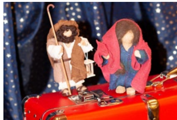
Advents-Koffer mit Maria und Josef