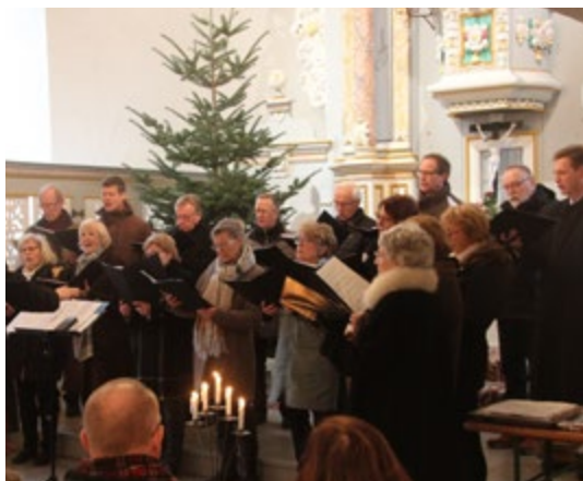
Musikalische Adventseröffnung 2019 in Niedernissa