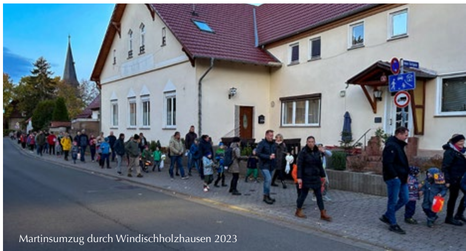
Martinsumzug durch Windischholzhausen 2023