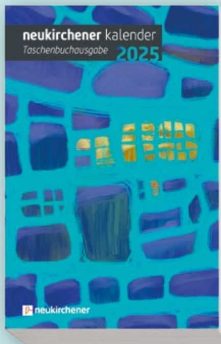
Taschenbuchausgabe, Art.-Nr. 613.051

Oder bestellen Sie gleich eine der sechs verschiedenen Ausgaben unter www.neukirchener-verlage.de/kalender oder 0 28 45. 39 27 218 (Mo–Fr 8:30–16:00 Uhr)