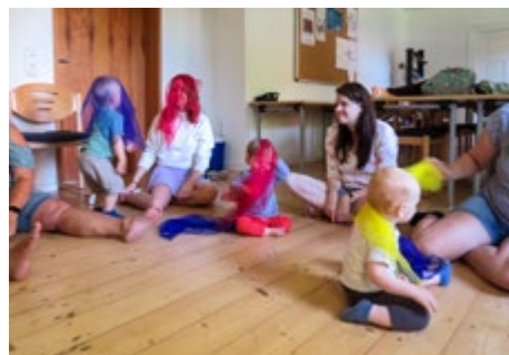
Gemeinsames Spiel in unserer Eltern-Kind-Gruppe in Büßleben

Seit einiger Zeit setzen wir das Weimar-Musik-Mentoring Projekt der Heyge-Stiftung auch in einer Eltern-Kind-Gruppe um. Die Kinder sind zwischen fünf Monaten und zwei Jahren alt und kommen wöchentlich mit ihren Muttis zum Musi-