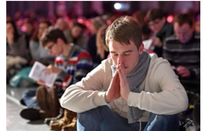
Jugendliche bei einem Gottesdienst in Prag