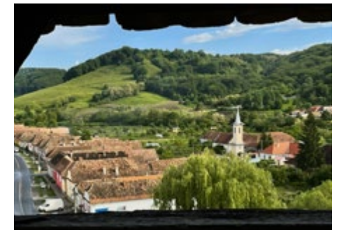
Blick von der Kirchenburg in Wurmloch/Valea Viilor