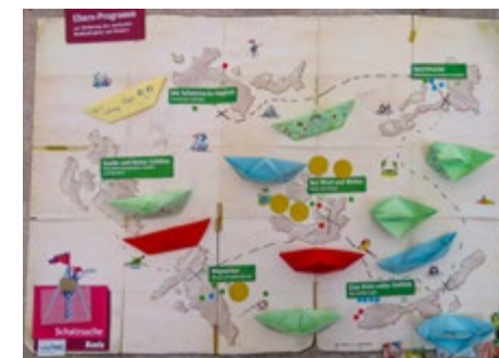
Die Schatzkarte einer gemeinsamen Lebensreise

te der insgesamt sechs Treffen und wollte keines versäumen. Unsere gemeinsame Reise hat sich für alle gelohnt.