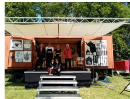
Das Teatr-O-mat Team

Aus verschiedenen möglichen Zutaten wählen die Zuschauer*innen ihre Favoriten. Aus diesen entsteht dann eine gemeinsame Mahlzeit. Welche geschmacklichen Erinnerungen teilt das Publikum mit den Akteuren auf der Bühne? An welche Reisen erinnert welches Rezept? Wie würde ein Loblied auf die Salatgurke klingen? Wer verträgt welche Zutat nicht und legt ein „Allergie-Veto“ ein? Wie wird Teatr-O-mat Küchenshow