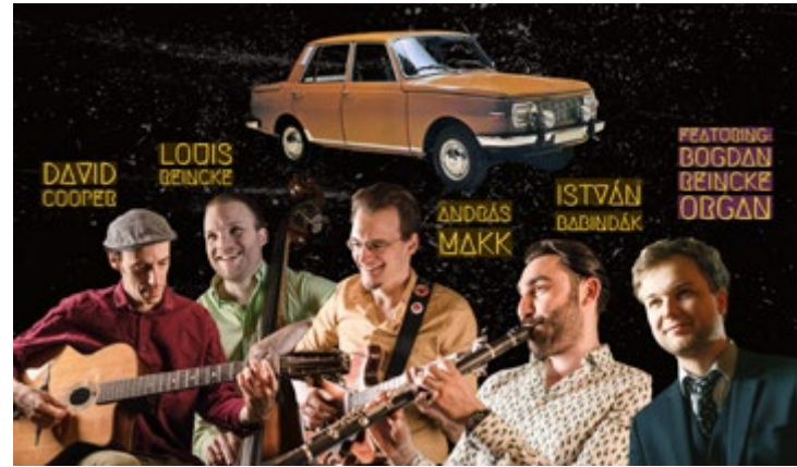
Valami Swing Band

ten und ersten Jazzmusiker Europas, teilen. Trotzdem begannen sie schnell,