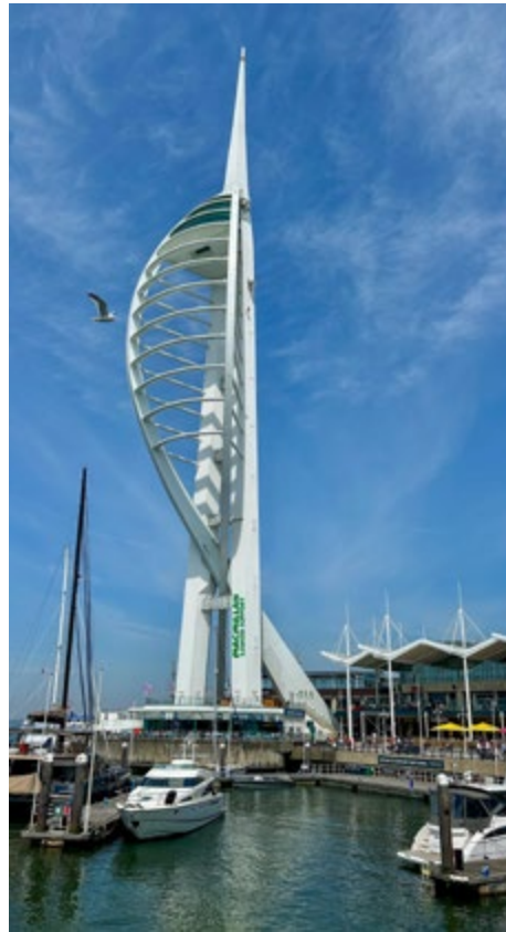
Spinnaker Tower in Portsmouth