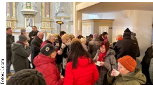
Ein heißer Kaffee nach der Musikalischen Adventseröffnung 2023 in Niedernissa